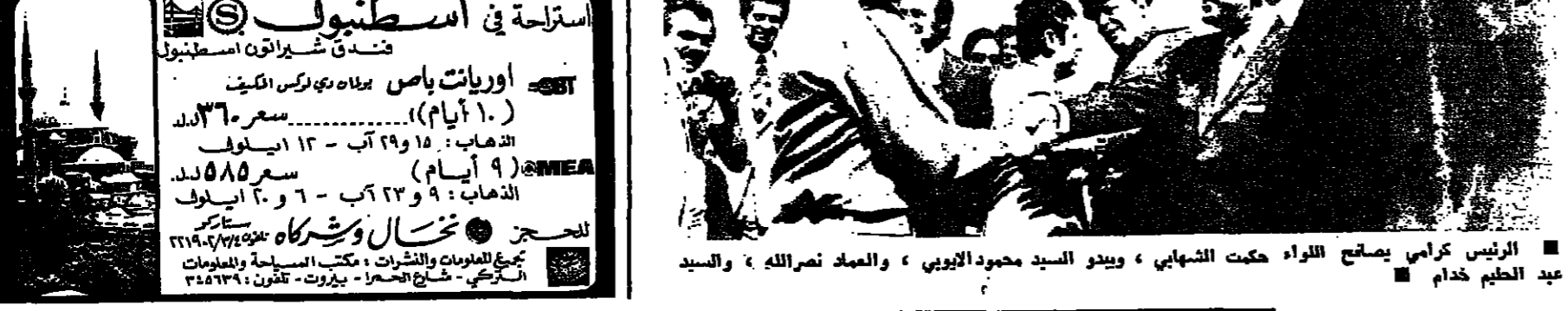
الرئيس كرامي يصافح اللواء حكمت الشهابي، ويبدو السيد محمود الابويي، والعماد نصرالله، والسيد عبد العظيم خدام

الرئيس كرامي يستعرض جرس الشرف عند الحدود السورية وفلسطين رئيس الحكومة السورية السيد محمود الابويي